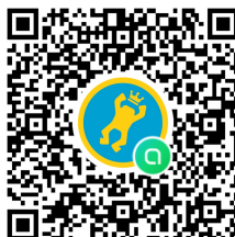
LINEオープンチャット

公式掲示はSAILFAST CUPの公式ホームページに掲示される。また参加者向けの連絡はLINEのオープンチャットを利用して発信する。